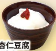
杏仁豆腐 180円(税込198円)