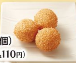
ごま団子(1個) 100円(税込110円) ※写真は3個です。