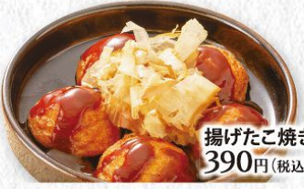
揚げたこ焼き 390円(税込429円)