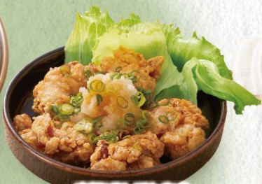
唐揚げみぞれ和え 490円(税込539円)