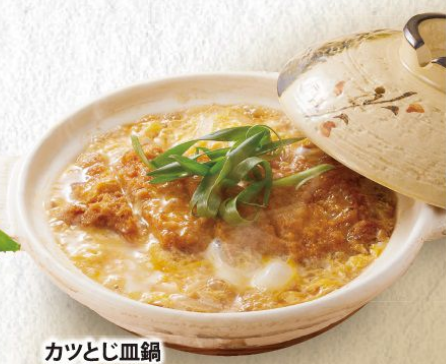
カツとじ血鍋 490円(税込539円)