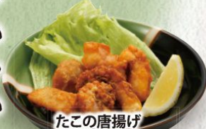
たこの唐揚げ 450円(税込495円)