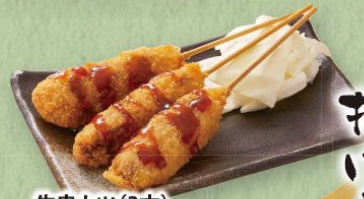
牛串カツ(3本) 490円(税込539円)