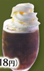
珈琲フロート 380円(税込418円)