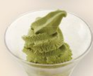
ソフトアイス(抹茶) 200円(税込220円)