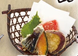
野菜の天ぷら 350円(税込385円)