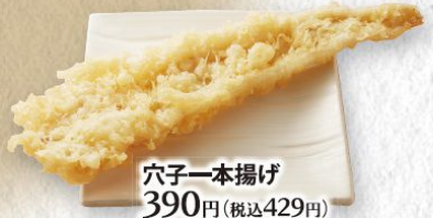
穴子一本揚げ 390円(税込429円)