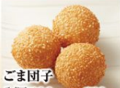
ごま団子 1個 100円(税込110円) ※写真は3個です。