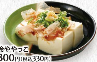
冷ややっこ 300円(税込330円)