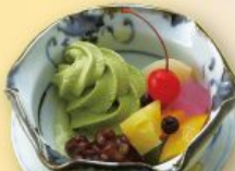
クリームあんみつ(抹茶) 480円(税込528円)