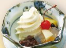
クリームあんみつ(バニラ) 480円(税込528円)