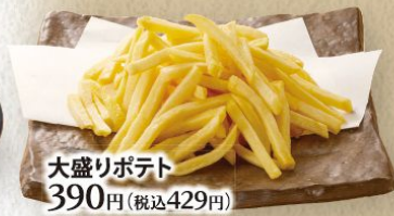
大盛りポテト 390円(税込429円) フライドポテト 200円(税込220円)