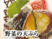
野菜の天ぷら 350円(税込385円)