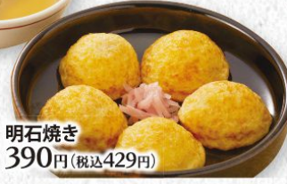
明石焼き 390円(税込429円)