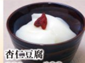
杏仁豆腐 180円(税込198円)