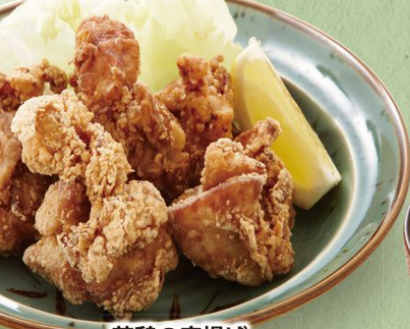
若鶏の唐揚げ 450円(税込495円)