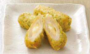
チーズちくわ磯辺揚げ(3個) 490円(税込539円)