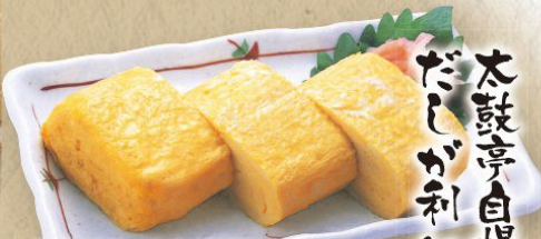
名物 だしまき玉子 380円(税込418円)