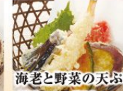
海老と野菜の天ぷら 480円(税込528円)