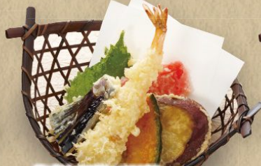
海老と野菜の天ぷら 480円(税込528円)