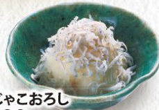
じゃこおろし 200円(税込220円)