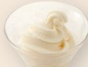
ソフトアイス(バニラ) 200円(税込220円)